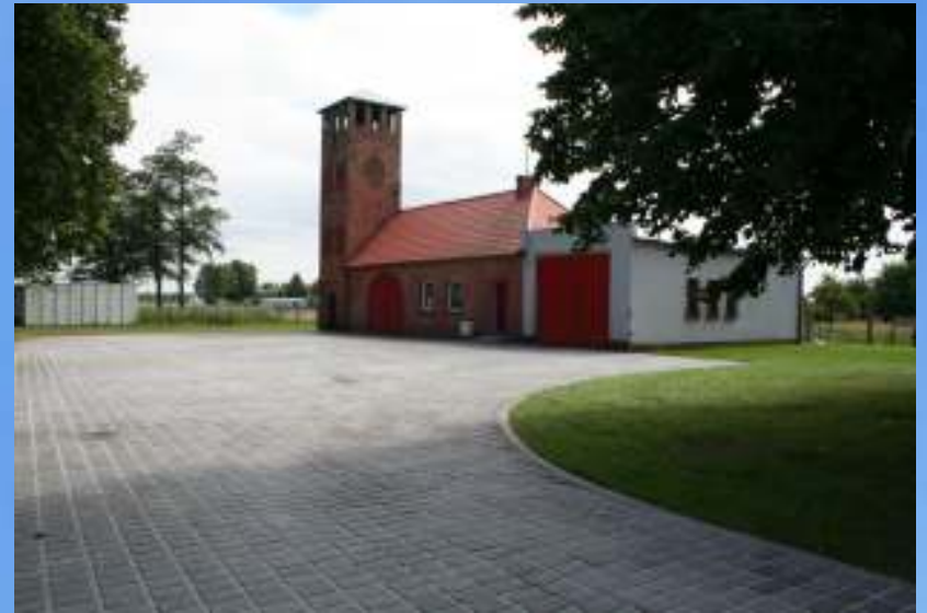
Teren przed OSP