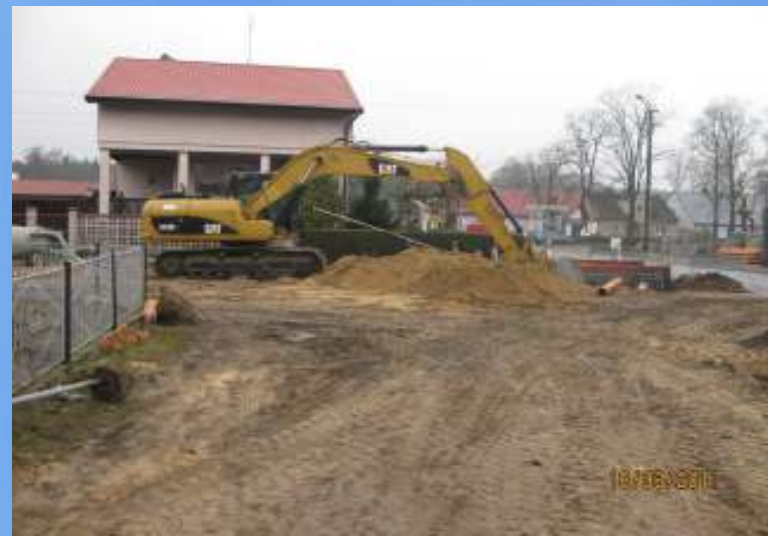
W trakcie prac – Jastrzębsko Stare