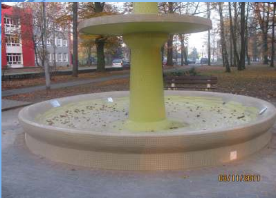
Fontanna po zakończeniu prac