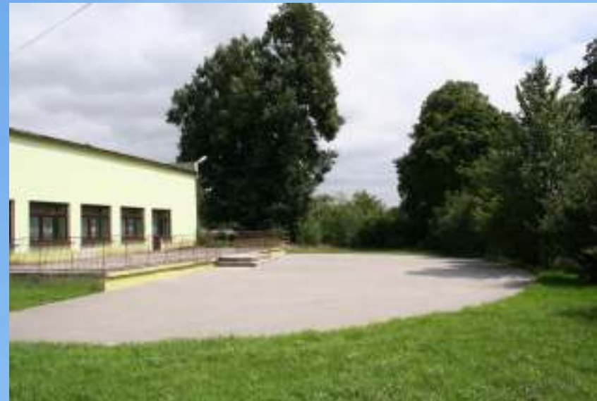
Teren przed WDK