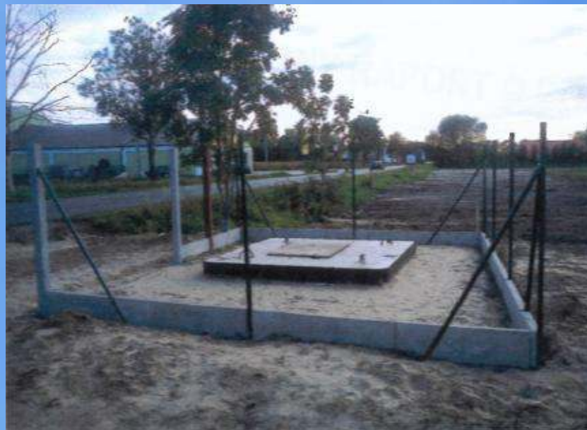
Etap I - w trakcie prac