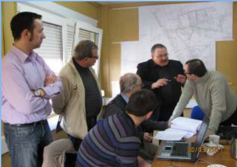
Rada Budowy – Jastrzębsko Stare