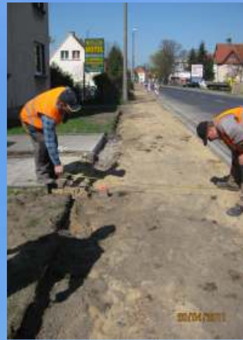
W trakcie prac