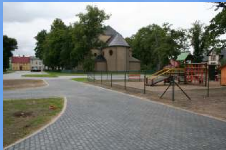
Odnowiony Plac Kościelny