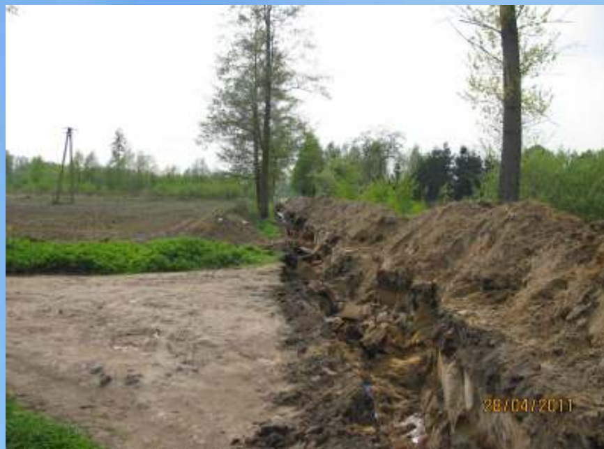
W trakcie robót