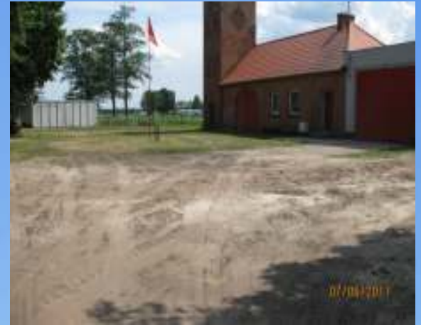
Przed rozpoczęciem robót