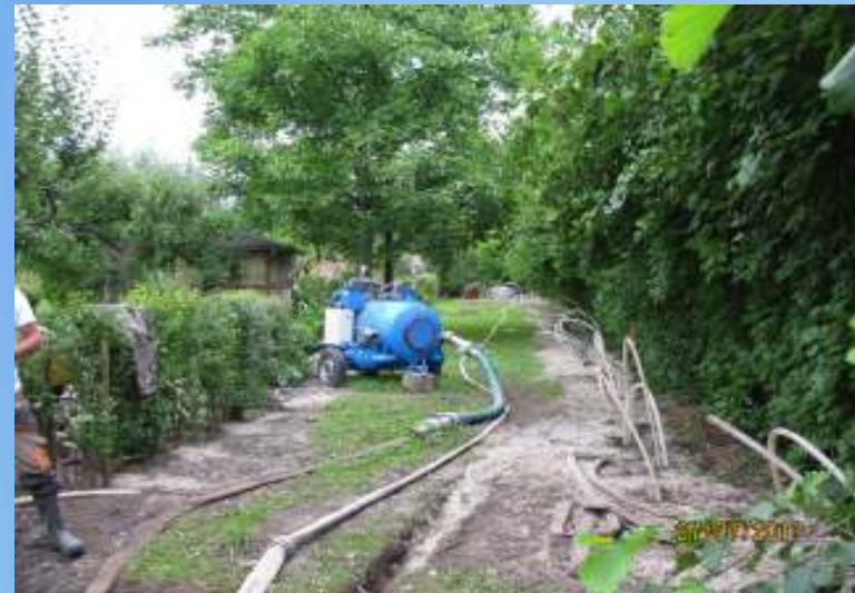
Ogródki działkowe – Nowy Tomyśl