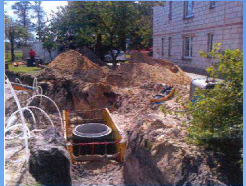
Etap II - w trakcie prac