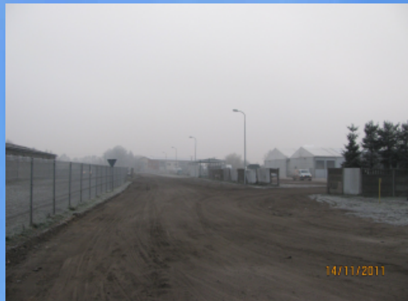
Po zakończeniu prac