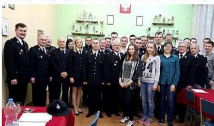
Wybory w OSP Jastrzębsko Stare