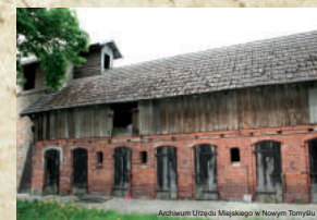
Archiwum Urzędu Miejskiego w Nowym Tomyslu