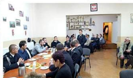
Wybory w OSP Boruja Kościelna