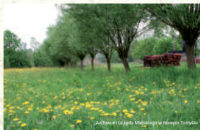
Archiwum Urzędu Miejskiego w Nowym Tomyslu