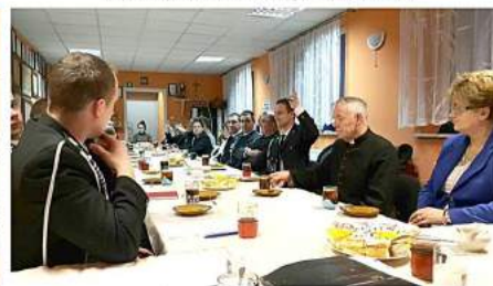
Wybory w OSP Sątopy