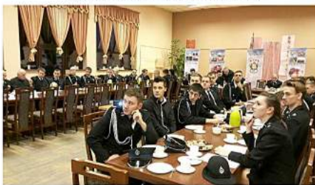
Wybory w OSP Bukowiec