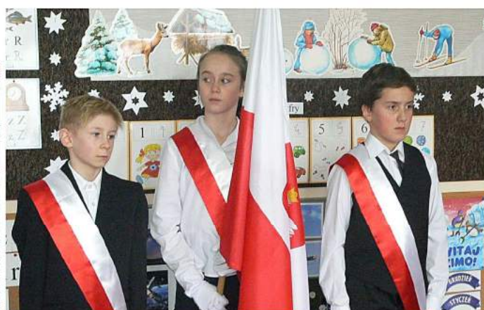
Obchody Dnia Pamięci „Żołnierzy Wyklętych” w Sątopach