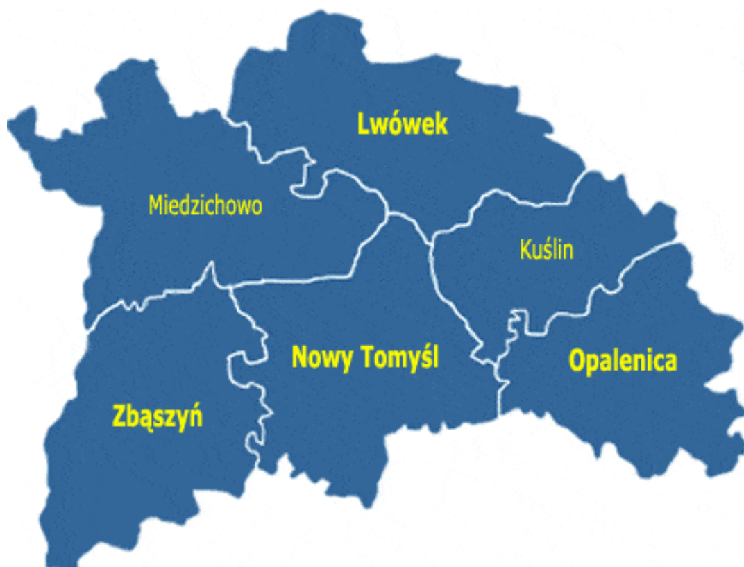
Rys. 1 Położenie gminy Nowy Tomyśl na tle powiatu nowotomyskiego

Gmina Nowy Tomyśl położona w województwie wielkopolskim, obejmuje obszar 186,1km 2 , zajmuje 18,4% powierzchni powiatu nowotomyskiego i graniczy od południa z gminami powiatu grodzkiego tj. Rakoniewice, Grodzisk Wielkopolski, od zachodu z gminą Zbąszyń, od północy z gminami Miedzichowo, Lwówek, a od wschodu z gminami Kuślin oraz Opalenica.